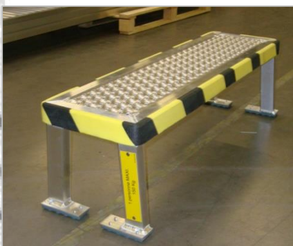
Marche pieds pour accès au plus près dans le train d'atterrissage