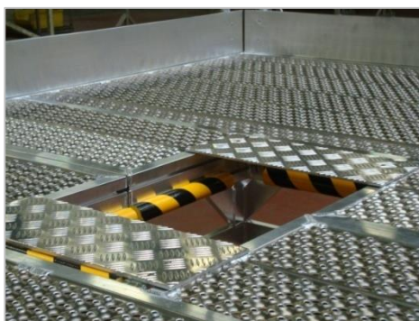
Découpe de la plateforme + protections pour « épouser » le train d'atterrissage