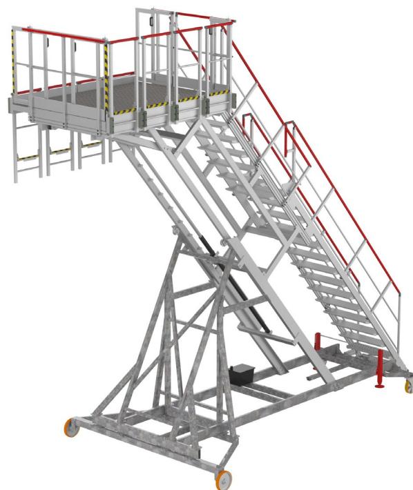
Vue 3D arrière de l'escabeau