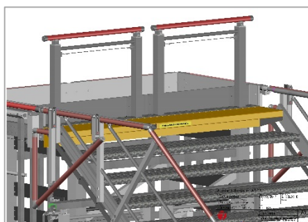
Mise en place de 2 garde-corps amovibles et demi coulissants en haut de l'escalier d'accès (sécurisation de l'opérateur) et stockables sous la plateforme