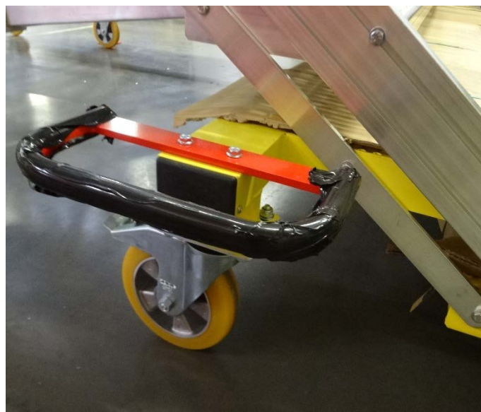
Roues Ø 200 mm à pivot à frein à l'avant et sur les côtés et fixes à l'arrière. En bandage polyuréthane (usage en atelier ou extérieur) à profil bombé pour une plus grande facilité de déplacement.