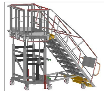
Escabeau en position haute