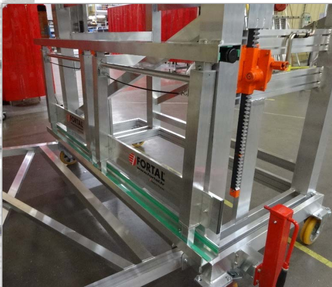
Vue sur système de treuil à crémaillère pour escalier à angle variable et béquilles de stabilisation.