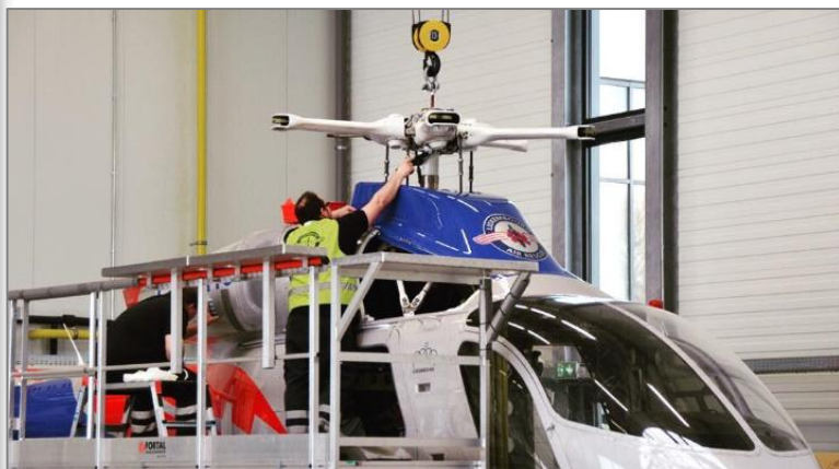
Plateforme en situation d'utilisation