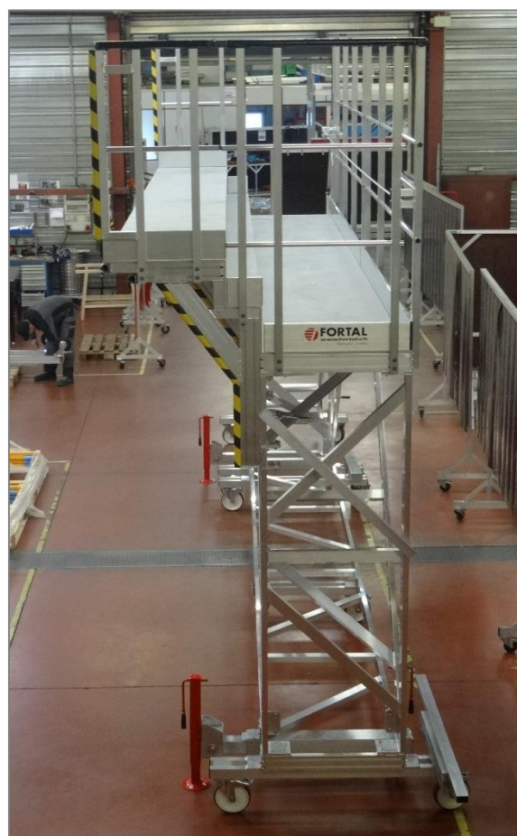
Plateforme 3 000 x 1 100 mm , porte à faux de 350 mm avec protection caoutchouc côté avion.