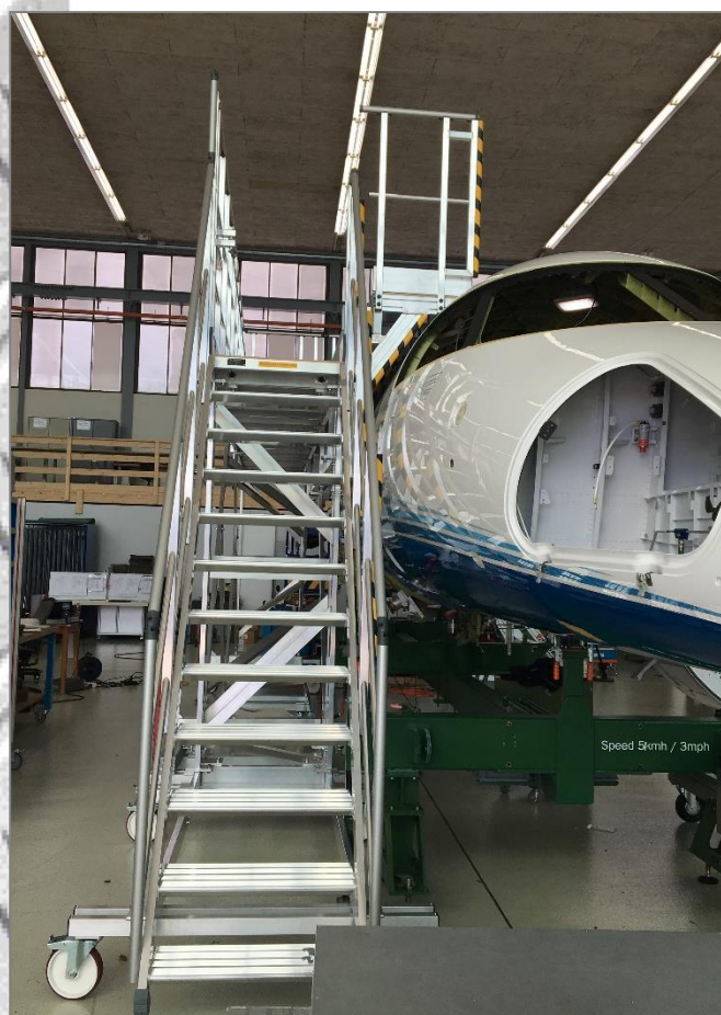
Escalier d'accès largeur utile 600 mm avec marches en aluminium antidérapantes prof. 261 mm Garde-corps sur 3 côtés – rampes et lisses en aluminium anodisé Palier équipé de 2 points de fixation pour harnais.