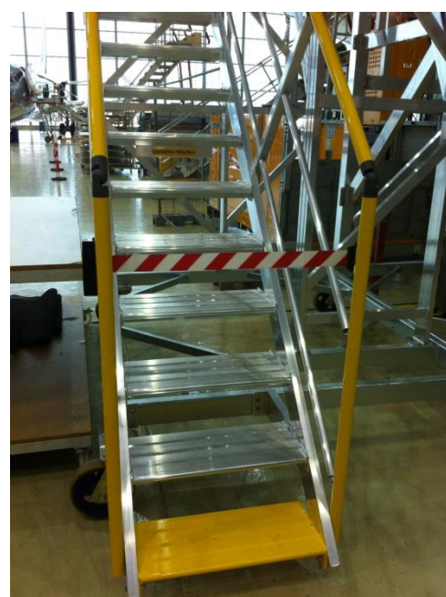
La 1 ère et dernière marche laquées jaune

Châssis en acier galvanisé - plate forme dimensions 4,5 x 3,6 mètres – revêtement bois – hauteur réglable de 4,5 à 5,8 mètres par vérins hydraulique et pompe à main – garde-corps coulissants sur la plate forme pour permettre le chargement et le déchargement de matériel – poids total : 2,2 tonnes – facile à déplacer par seulement 3 personnes grâce à des roues à frein Ø 260 mm. Charge d'exploitation : 750 kg