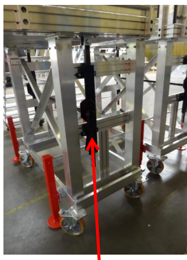
Système à crémaillère pour réglage en hauteur de la plate forme