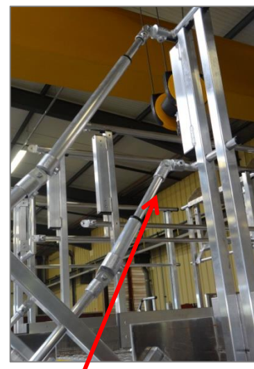
Haut de rampe télescopique

Praticable accès gauche / droite dérive hélicoptère Dauphin N3/N4 :