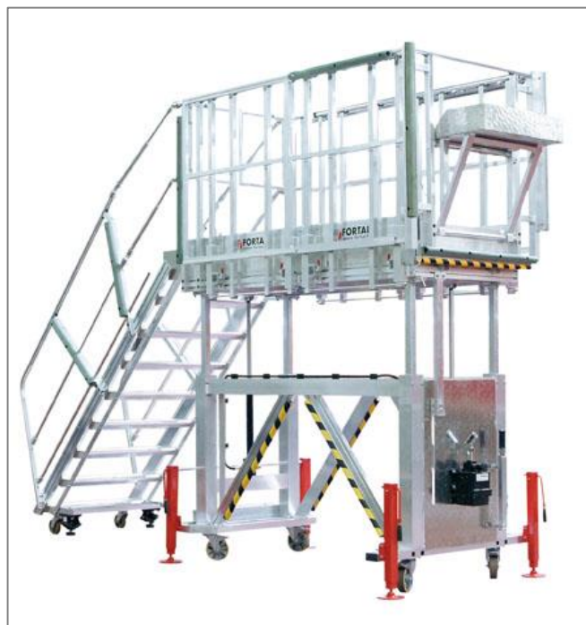
Plateforme en position haute