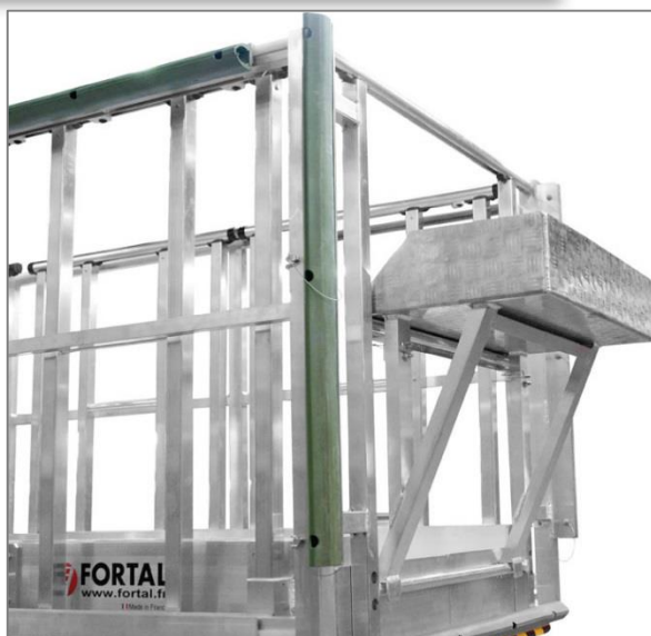
Tablette porte-outils amovible