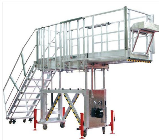
Plateforme en position haute – surface de travail agrandie