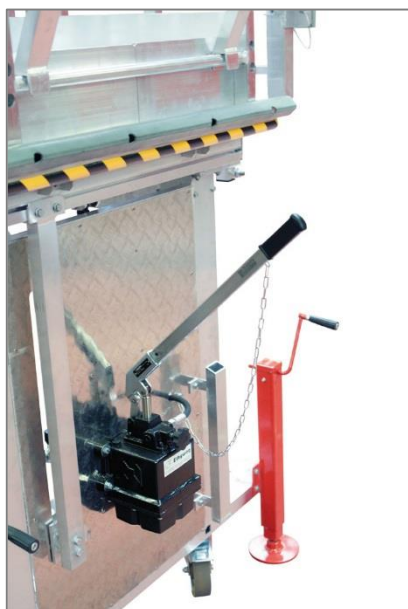
Pompe à main hydraulique et béquille d'immobilisation

Escalier à angle variable avec marches aluminium antidérapantes ép. 261 mm